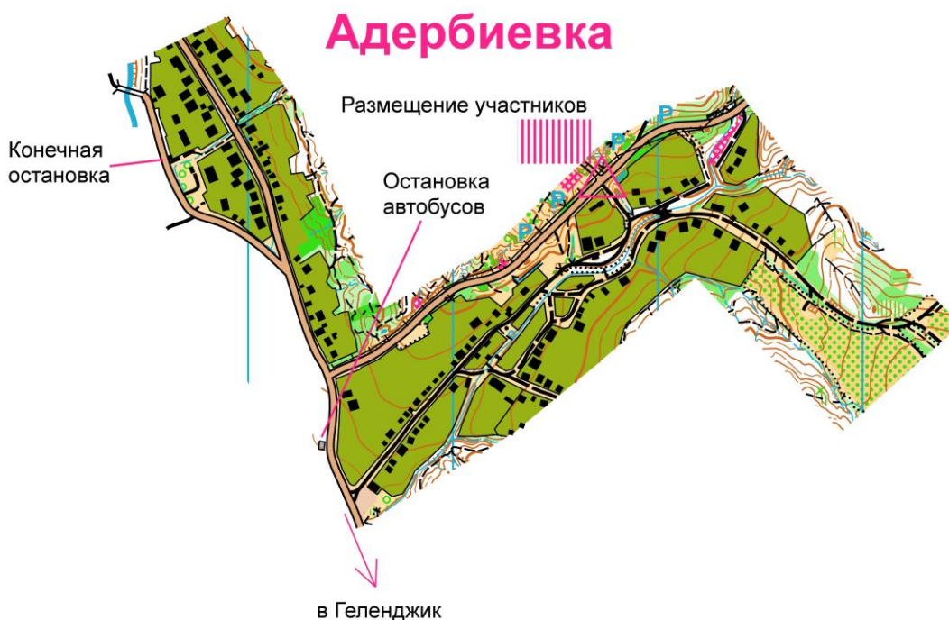
Схема старта и финиша 13-14 февраля