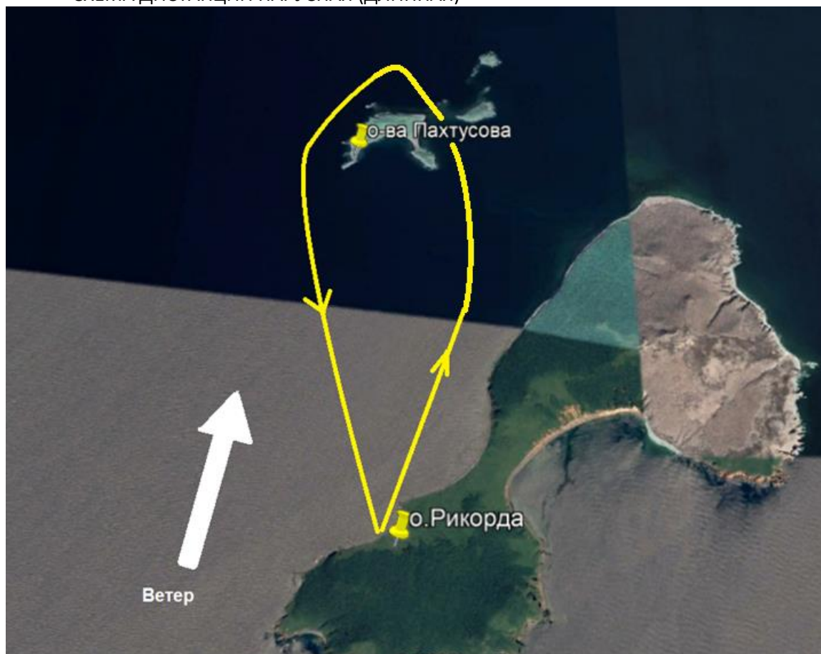
СХЕМА ДИСТАНЦИИ ПАРУСНАЯ (ДЛИННАЯ)