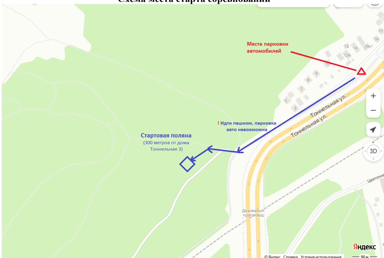
Схема места старта соревнований